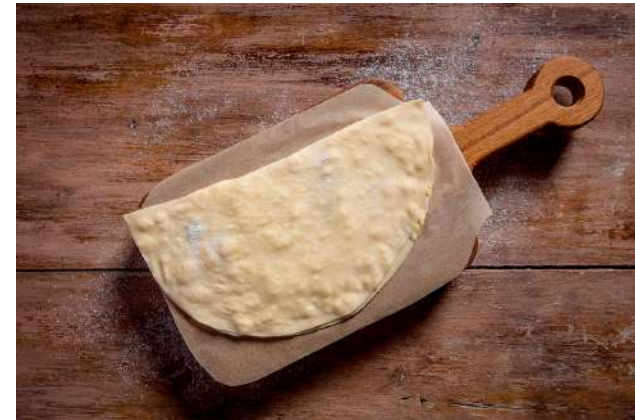
Кутаб с сыром 60г