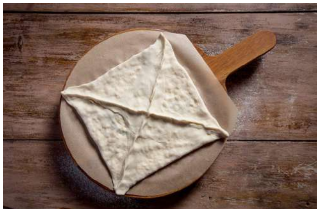
Хачапури пеновани 250г