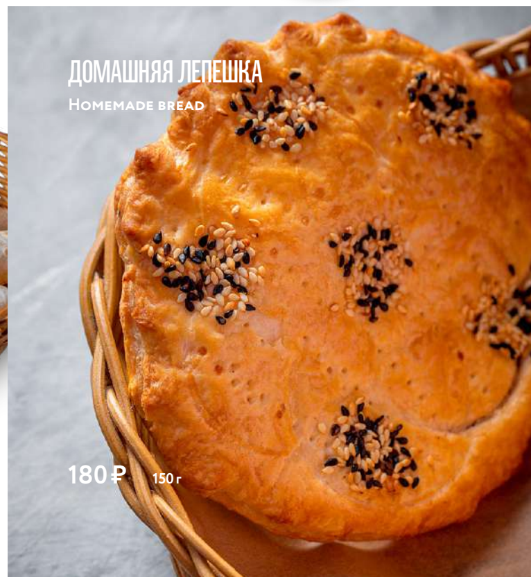
ДОМАШНЯЯ ЛЕПЕШКА HOMEMADE BREAD