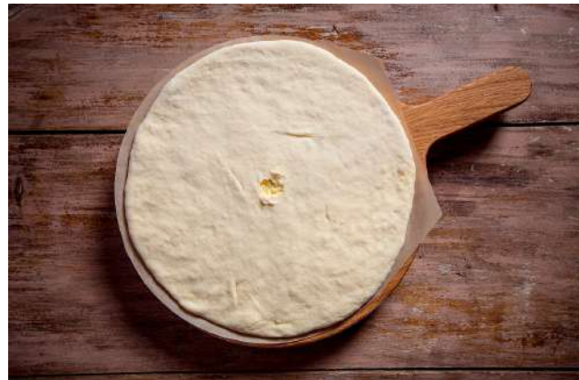
Хачапури по-имеретински 450г