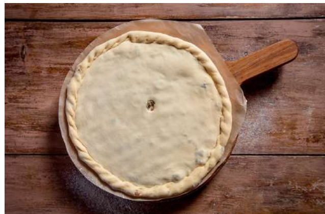
Кудари с телятиной по-свански 500г