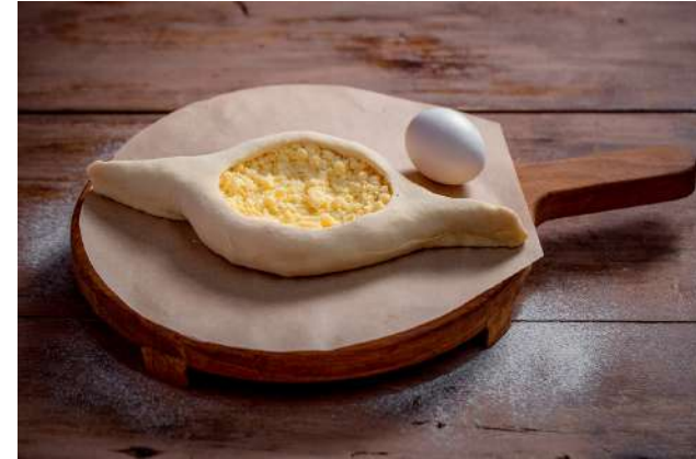
Хачапури по-аджарски 340г