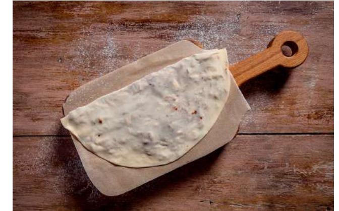
Кутаб с лобио 90г