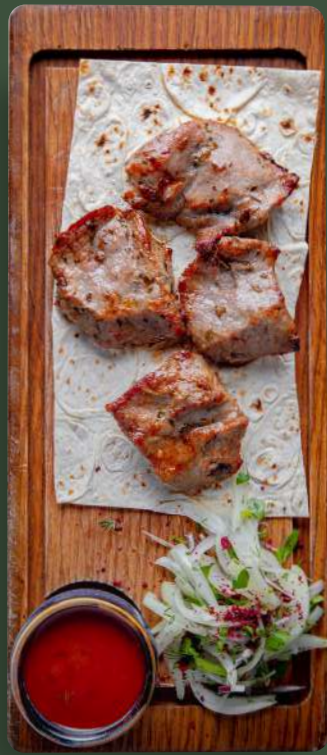
ШАШЛЫК ИЗ ТЕЛЯТИНЫ ПО-ГРУЗИНСКИ GEORGIAN VEAL SHISH KEBAB