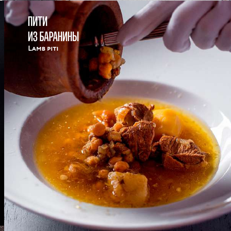
ПИТИ ИЗ БАРАНИНЫ LAMB PITI