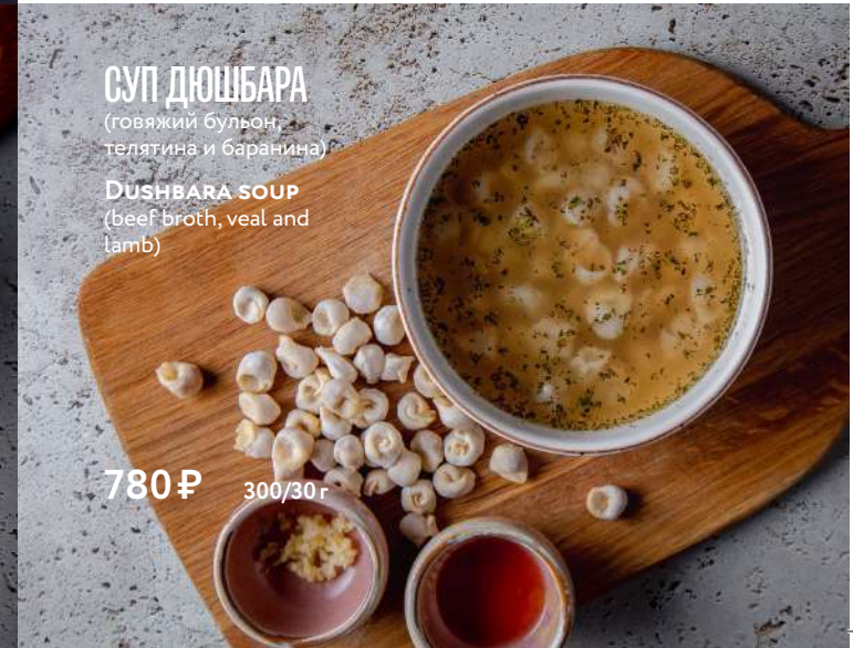
СУП ДЮШБАРА (говяжий бульон, телятина и баранина) DUSHBARA SOUP (beef broth, veal and lamb)