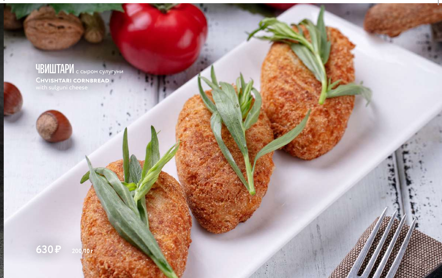
ЧВИШТАРИ с сыром сулгуни CHVISHTARI CORNBREAD with sulguni cheese