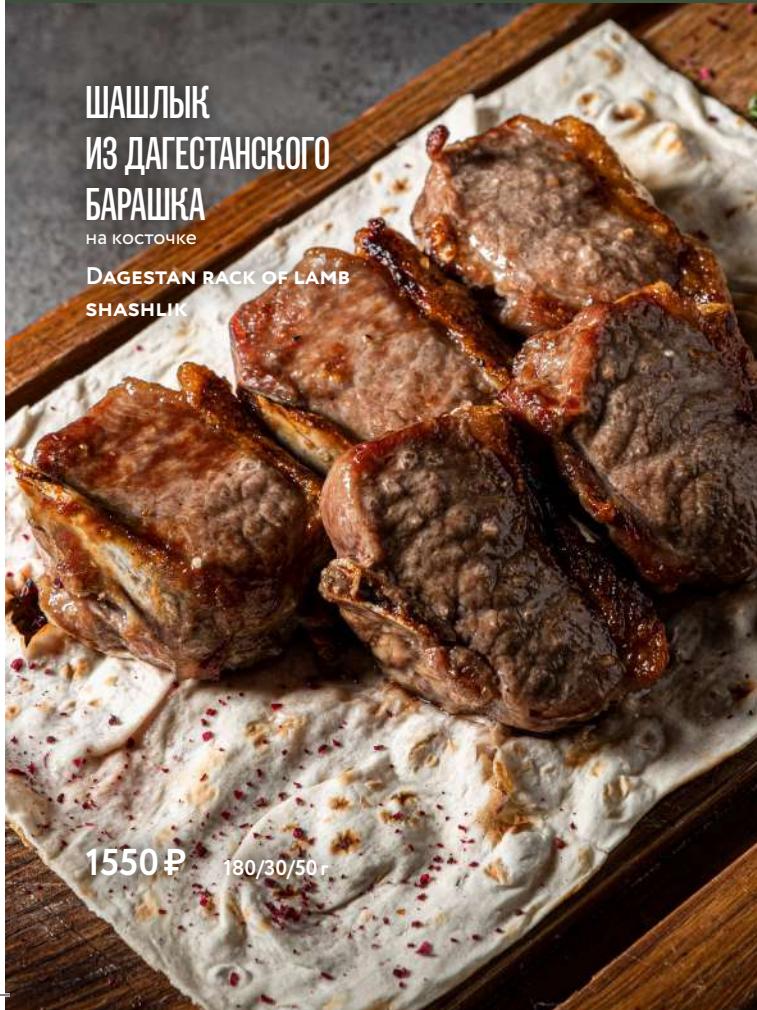
ШАШЛЫК ИЗ ДАГЕСТАНСКОГО БАРАШКА на косточке DAGESTAN RACK OF LAMB SHASHLIK