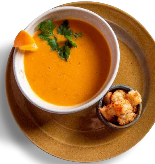
СУП ИЗ ЧЕЧЕВИЦЫ по-турецки TURKISH STYLE LENTILS SOUP