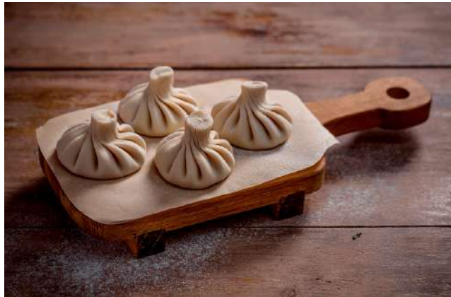
Хинкали с бараниной/говядиной 90г