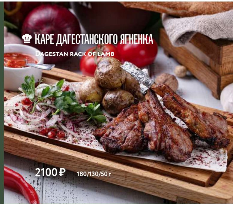
КАРЕ ДАГЕСТАНСКОГО ЯГНЕНКА DAGESTAN RACK OF LAMB