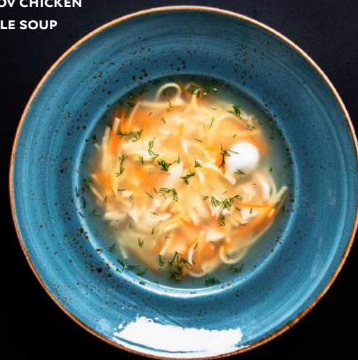
СУП ЛАПША из домашней тамбовской курицы TAMBOV CHICKEN NOODLE SOUP