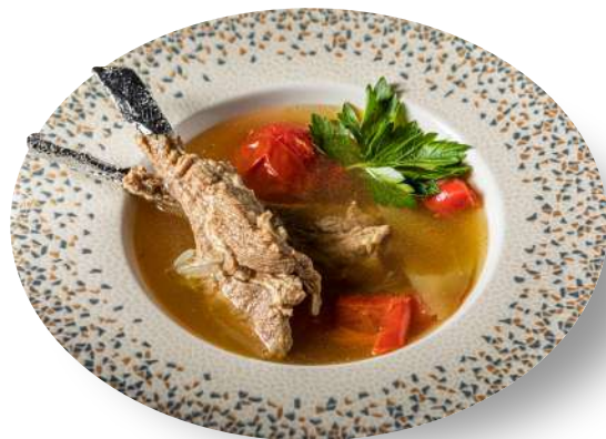
ХАШЛАМА ИЗ ЯГНЕНКА LAMB KHASHLAMA