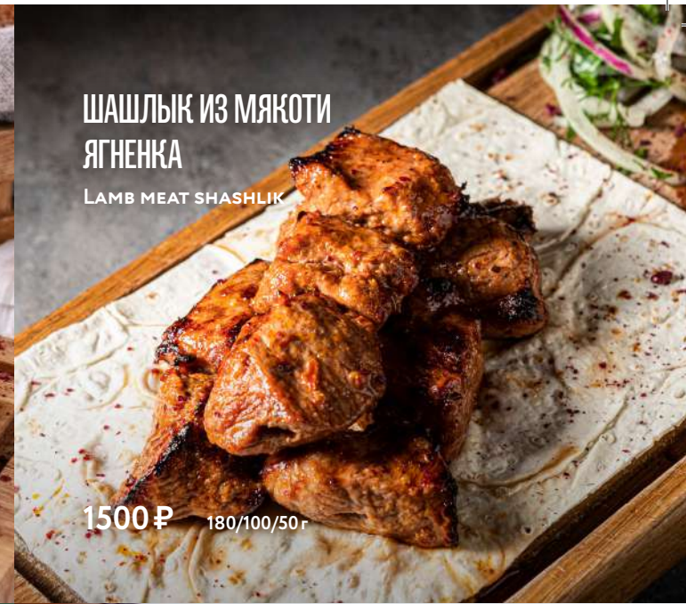
ШАШЛЫК ИЗ МЯКОТИ ЯГНЕНКА LAMB MEAT SHASHLIK