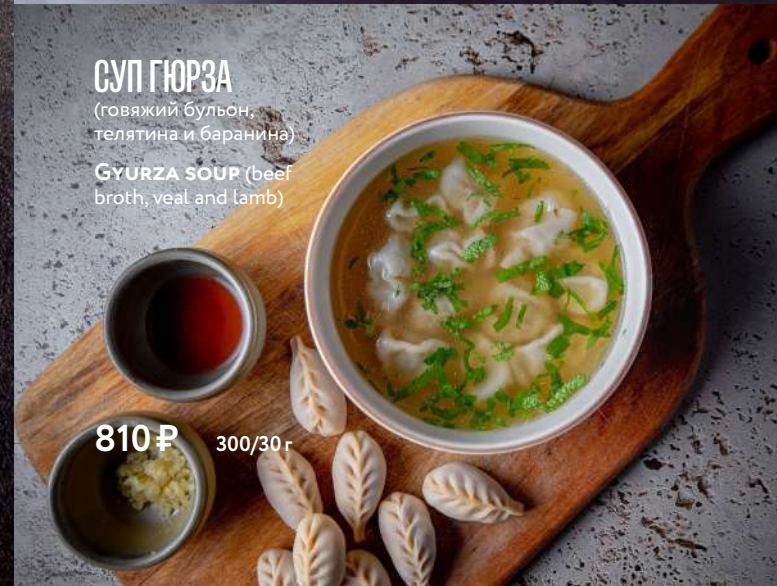
СУП ГЮРЗА (говяжий бульон, телятина и баранина) GYURZA SOUP (beef broth, veal and lamb)