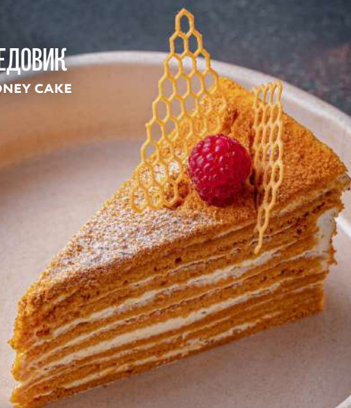
МЕДОВИК HONEY CAKE