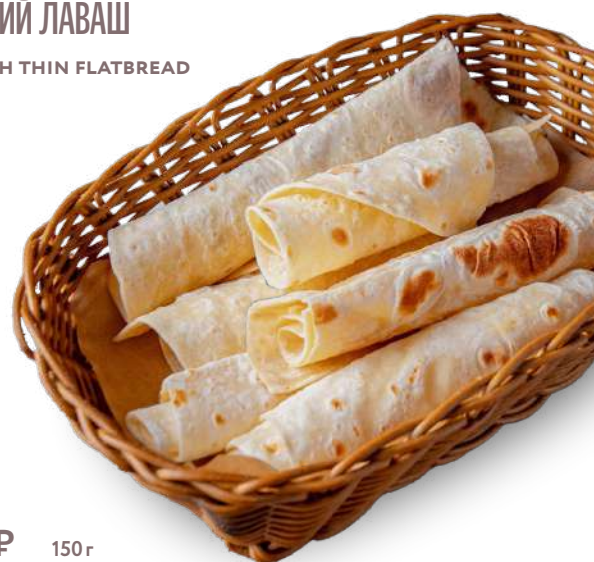
ТОНКИЙ ЛАВАШ LAVASH THIN FLATBREAD