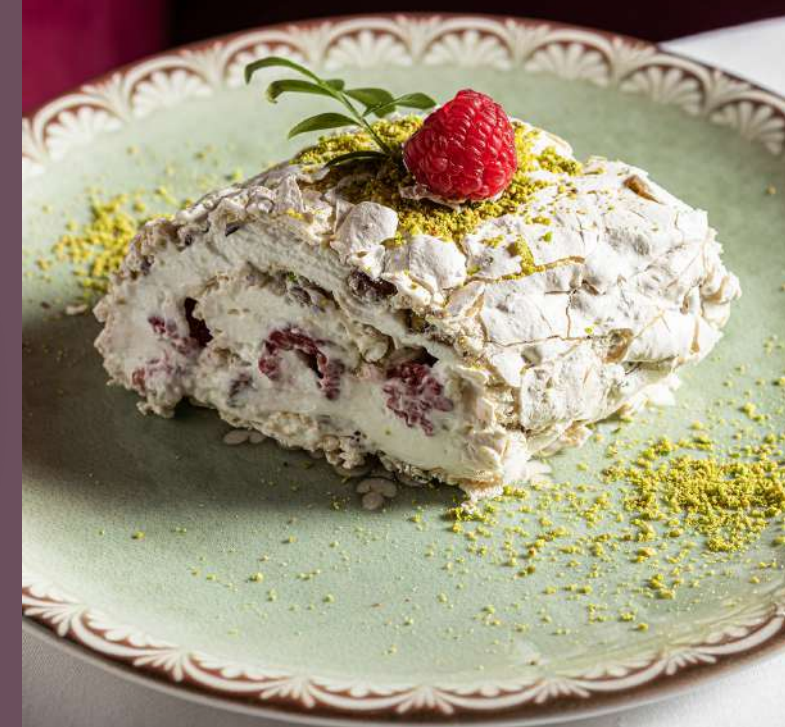
МЕРЕНГОВЫЙ РУЛЕТ с малиной MERINGUE ROLL with raspberry