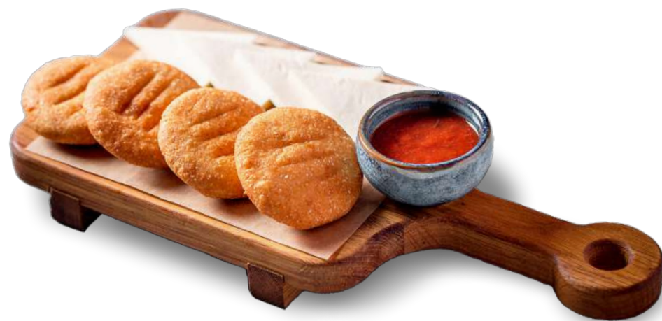
МЧАДИ с сыром сулгуни и соусом ткемали GEORGIAN CORNBREAD MCHADI with sulguni cheese and tkemali sauce