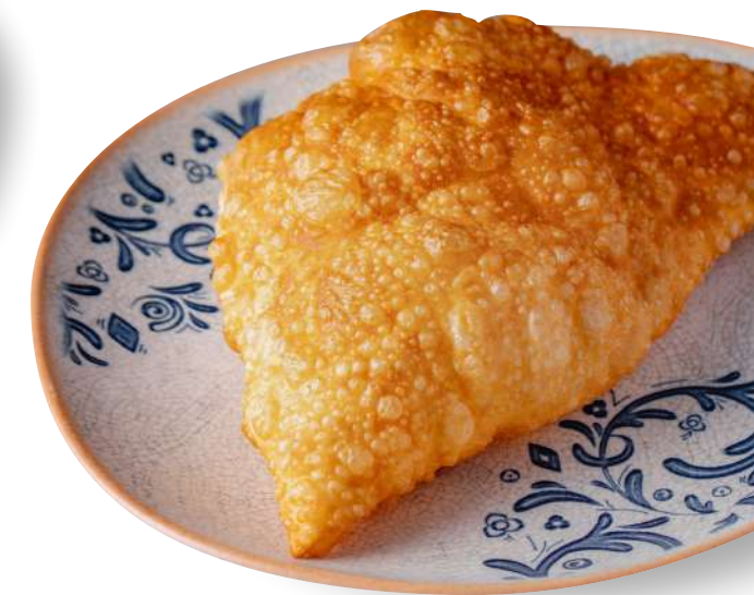
ЧЕБУРЕК с говядиной/бараниной CHEBUREK with beef or lamb