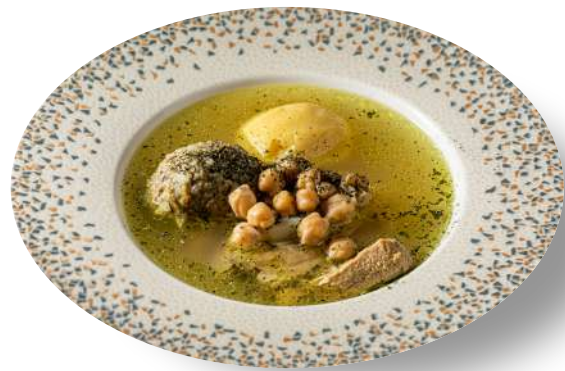
КЮФТА-БОЗБАШ из баранины и говядины LAMB AND BEEF KUFTA BOZBASH