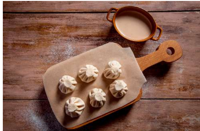
Мини-хинкали с телятиной 300г