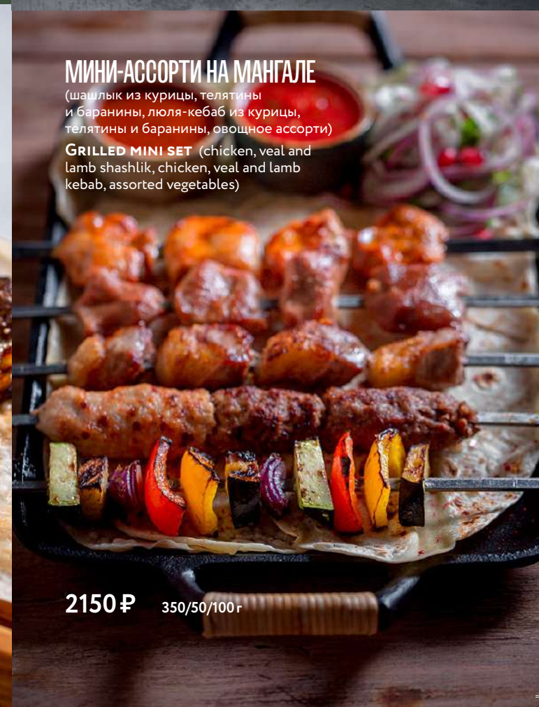
МИНИ-АССОРТИ НА МАНГАЛЕ (шашлык из курицы, телятины и баранины, люля-кебаб из курицы, телятины и баранины, овощное ассорти) GRILLED MINI SET (chicken, veal and lamb shashlik, chicken, veal and lamb kebab, assorted vegetables)