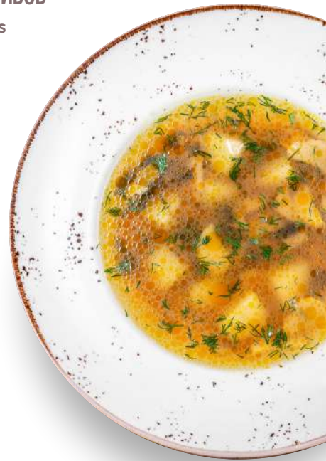
СУП ИЗ БЕЛЫХ ГРИБОВ PORCINI MUSHROOMS SOUP