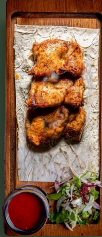
ШАШЛЫК ИЗ КУРИЦЫ CHICKEN SHISH KEBAB