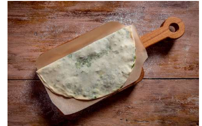
Кутаб с зеленью 90г