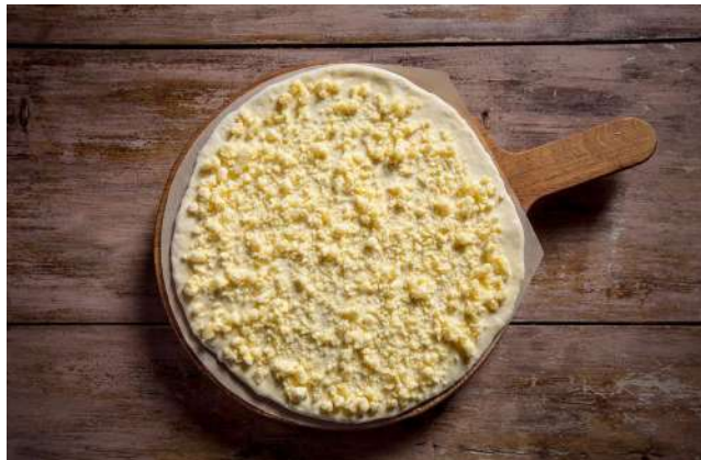
Хачапури по-мегрельски 450г