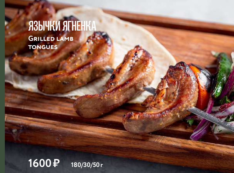
ЯЗЫЧКИ ЯГНЕНКА GRILLED LAMB TONGUES