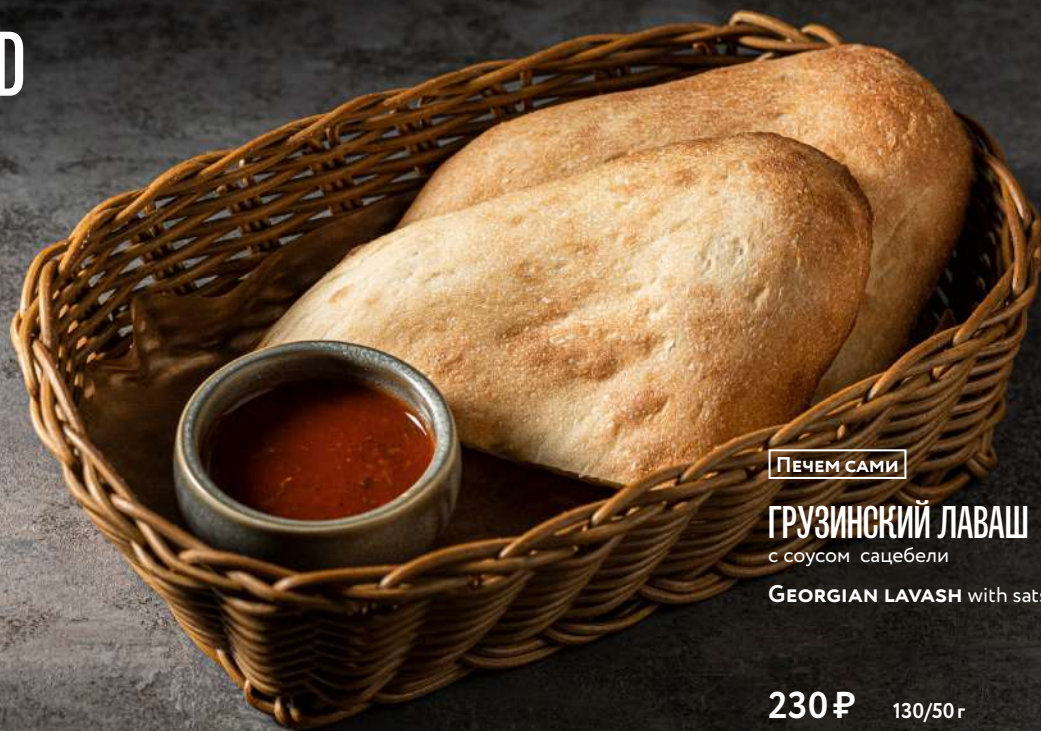
ПЕЧЕМ САМИ ГРУЗИНСКИЙ ЛАВАШ с соусом сацебели GEORGIAN LAVASH with satsebeli