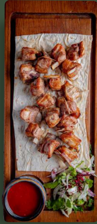
«СЕМЕЧКИ» ИЗ БАРАНИНЫ LAMB RIBS