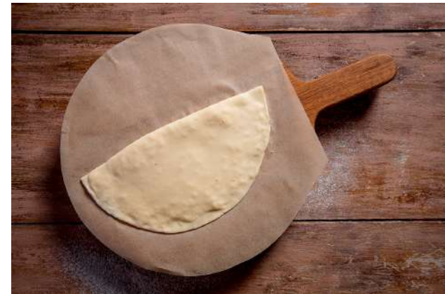
Чебурек с бараниной/говядиной 90г