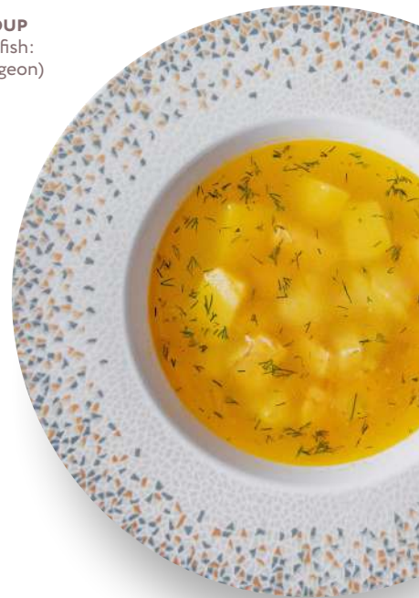
УХА ПО-ТБИССКИ на бульоне из трех видов рыб: лосось, судак, осетр TBILISI STYLE FISH SOUP (broth of three types of fish: salmon, pike perch, sturgeon)